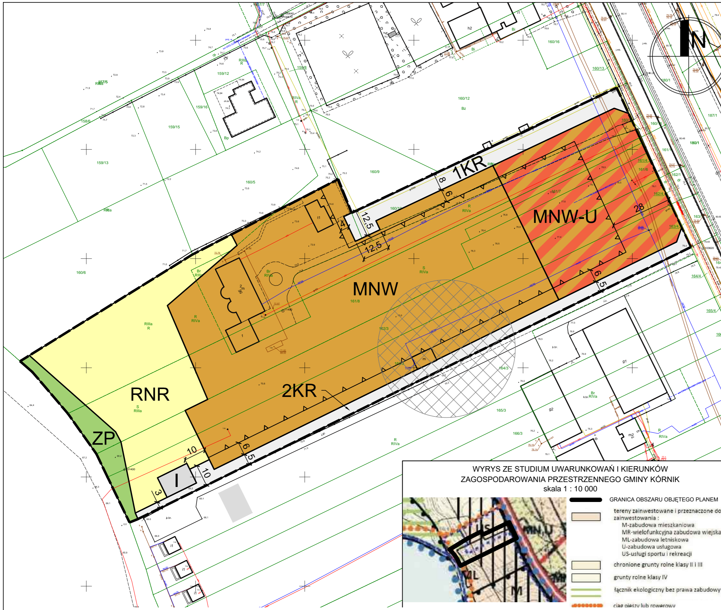
WYRYS ZE STUDYUM UWARUNKOWAŃ I KIERUNKÓW ZAGOSPODAROWANIA PRZESTRZENNEGO GMINY KÓRNIK skala 1 : 10 000

Opracowanie na podstawie mapy zasadniczej w postaci wektorowej