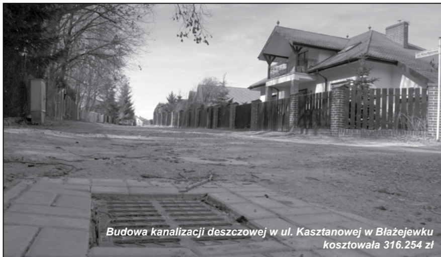
Budowa kanalizacji deszczowej w ul. Kasztanowej w Błażejewku kosztowała 316.254 zł