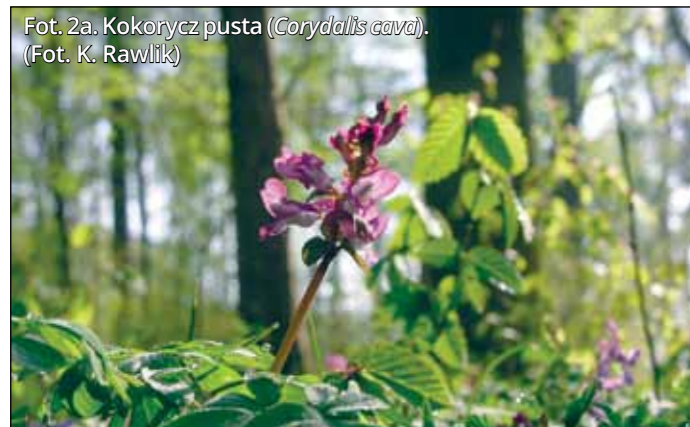
Fot. 2a. Kokorycz pusta ( Corydalis cava ).

♦ Katarzyna Rawlik Instytut Dendrologii PAN