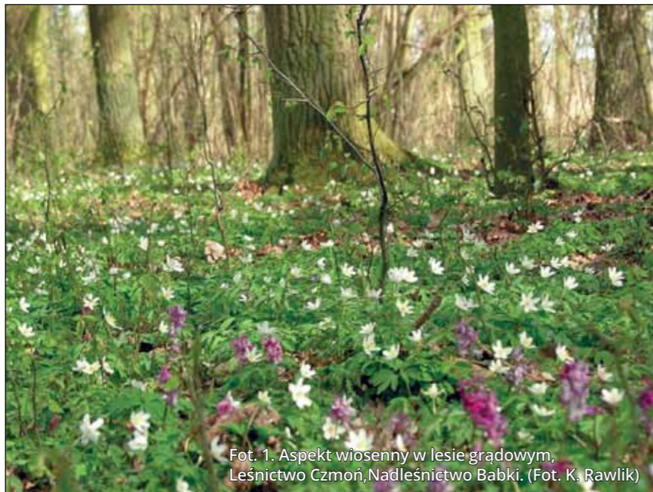
Fot. 1. Aspekt wiosenny w lesie grądowym, Leśnictwo Czmoń, Nadleśnictwo Babki.

Geofity wiosenne są to rośliny, które realizują cały cykl życiowy (kiełkowanie, wzrost, kwitnienie i owocowanie) w okresie braku ulistnienia u drzew. Jest to ich główne przystosowanie do warunków panujących na dnie lasu, w którym ograniczenie dostępu światła jest głównym „kłopotem” roślin. Geofity wiosenne nie tolerują zacienienia oraz suszy, które panują na dnie lasu w pełni sezonu wegetacyjnego. Takie pory roku jak lato, jesień i zima przeżywają w formie podziemnych organów przetrwalnikowych, np. jako cebule i kłącza. Pozwala im to na szybkie użycie zgromadzonych w tychże organach cukrów wiosną, gdy warunki są sprzyjające do wzrostu. Na ogół od końca marca do końca maja trwa okres ich szalonego wzrostu (choć dzisiaj, w dobie wyraźnej zmiany klimatu, często swój rozwój zaczynają znacznie wcześniej). Nasze