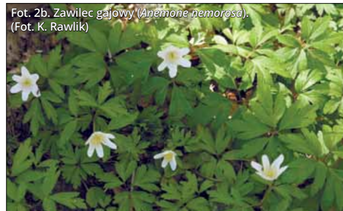
Fot. 2b. Zawilec gajowy ( Anemone nemorosa ).