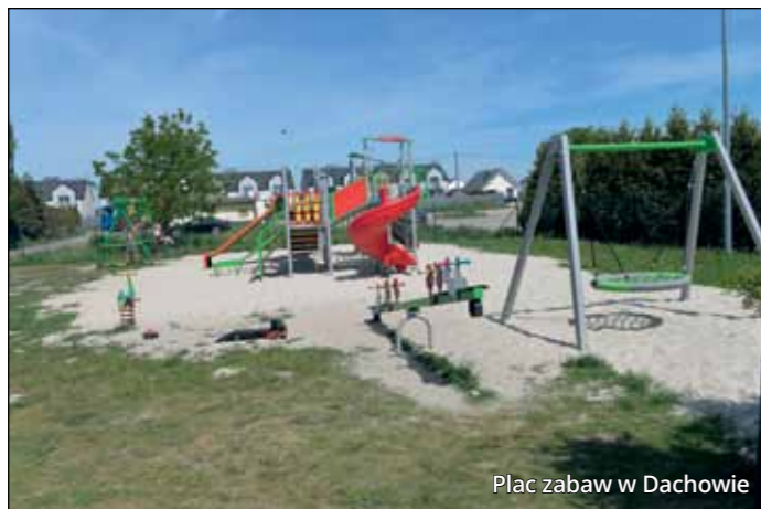
Plac zabaw w Dachowie