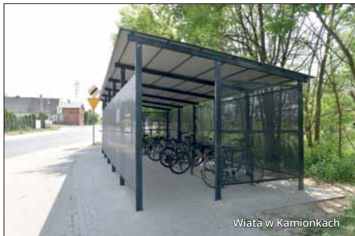
Wiaty w Kamionkach