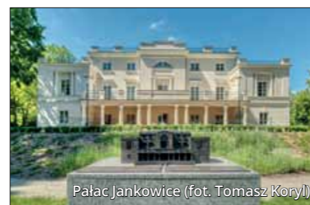
Pałac Jankowice

Część pałaców i dworów stanowi własność prywatną, co często sprzyja ich sukcesywnemu remontowi, ale jednocześnie niekiedy utrudnia lub uniemożliwia ich zwiedzanie. Wśród obiektów należących do tej grupy na uwagę zasługują pałace Radomickich w Konarzewie, Fredericiego w Czerlejnii, Krzyckich w Siedlcu, Kęszyckich w Błociszewie, von Reussów w Niepruszewie, książąt von Sachsen-Altenburg w Boduszewie oraz pałac w Lusowie, dawna własność generała Józefa Dowbora Muśnickiego. Do listy trzeba