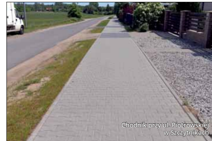
Chodnik przy ul. Piotrowskiej w Szczytnikach