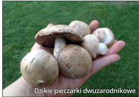
Dzikie pieczarki dwuzarodnikowe

Promenada im. Wisławy Szymborskiej, położona nad Jeziorem Kórnickim, jest miejscem spacerów dla wielu mieszkańców Kórnicka, a także licznych turystów. Rozciąga się z niej piękny widok na samo jezioro oraz znajdujący się po jego drugiej stronie