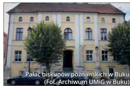
Pałac biskupów poznańskich w Buku