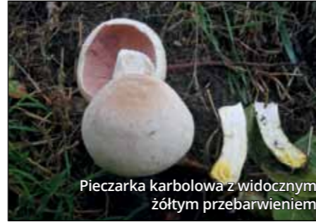
Pieczarka karbolowa z widocznym żółtym przebarwieniem

Las Doświadczalny Zwierzyniec. Przy tak malowniczych widokach trudno zwracać uwagę na to, co dzieje się przy ścieżce kórnickiej promenady. Jak się okazuje – dzieje się całkiem sporo! Co roku, począwszy od późnego kwietnia, na pierwszych dniach grudnia kończąc, w okolicach jeziora swoje białe kapelusze wychylają różne gatunki pieczarek. Tutaj nasuwa się pytanie: skoro pieczarki to grzyby sprzedawane w sklepie, to czy można je zebrać i położyć na zapiekankę? Odpowiedź brzmi: zależy.