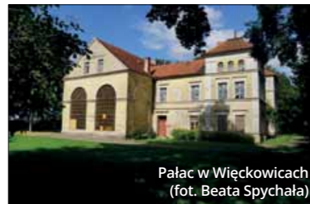
Pałac w Więckowicach

stał się popularnym miejscem wydarzeń kulturalnych – od spotkań poetyckich po ogólnopolski festiwal piosenki. Dwór w pobliskim Sierosławiu pełni funkcję świetlicy wiejskiej. Gospodarzem pałacu Bnińskich w Gultowach jest obecnie Uniwersytet im. Adama Mickiewicza w Poznaniu, a pałac Mielżyńskich w Iwnie jest użytkowany przez tamtejszą stadninę koni. Oba obiekty są dostępne do zwiedzania po wcześniejszym umówieniu. Wnętrza efektownego pałacu Szołdrskich w Psarskim koło Śremu służą obecnie podopiecznym Domu Pomocy Społecznej. Objezierski pałac Turnów zasłynął jako jeden z najznakomitszych salonów literackich Wielkopolski, a dziś służy uczniom tamtejszej szkoły, podobnie jak pałac Tempelhoffów w Dąbrówce (o dawnych właścicielach przypomina tablica przy ruinach parkowej kaplicy).