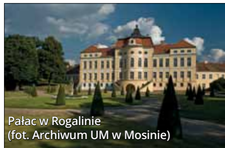
Pałac w Rogalinie

Dawne siedziby arystokracji czy szlachty często zyskują drugie życie jako muzea. Tak stało się w przypadku jedynych dwóch pomników historii na terenie