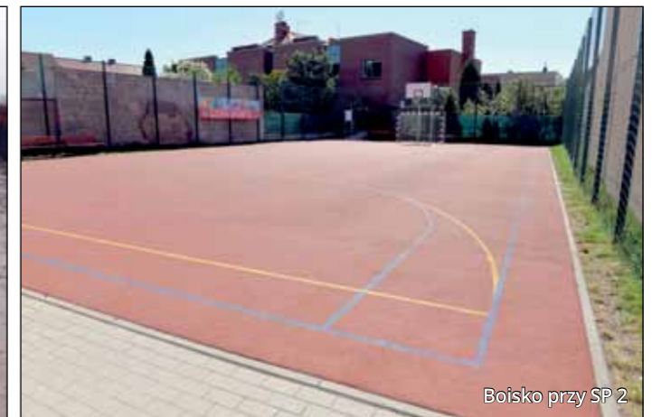
Boisko przy SP 2