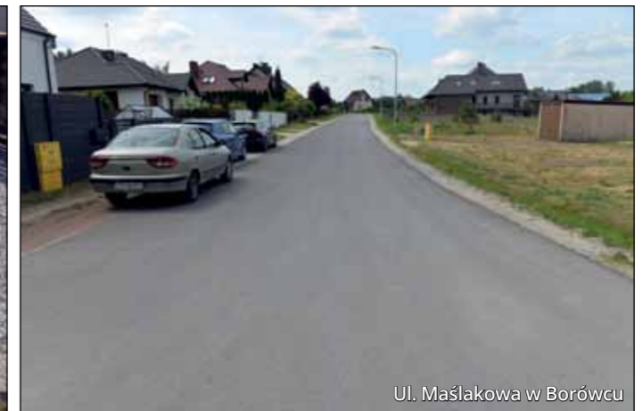
Ul. Maślakowa w Borówcu