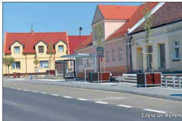
Część ul. Rynek