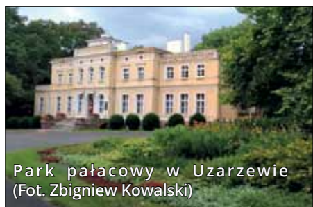
Park pałacowy w Uzarzewie

powiatu poznańskiego. Założenie parkowo-pałacowe Raczyńskich w Rogalinie funkcjonuje obecnie jako jedna z placówek Muzeum Narodowego w Poznaniu, a zamek w Kórniku – historyczna rezydencja Górków i Działyńskich – jest dziś muzeum i siedzibą Biblioteki Kórnickiej. W pałacu Żychlińskich w Uzarzewie można oglądać zbiory Muzeum Przyrodniczo-Łowieckiego, a pałac Greisera w Jeziorach odwiedzają dziś goście Muzeum Przyrodniczego Wielkopolskiego Parku Narodowego. Na wyspie pobliskiego Jeziora Góreckiego zobaczyć można zachowany w formie trwałej ruiny zameczek Klaudyny Potockiej. Listę zamków okolic Poznania zamyka betonowy obiekt na poligonie Biedrusko, zbudowany jako scenografia filmu „Kazimierz Wielki”.