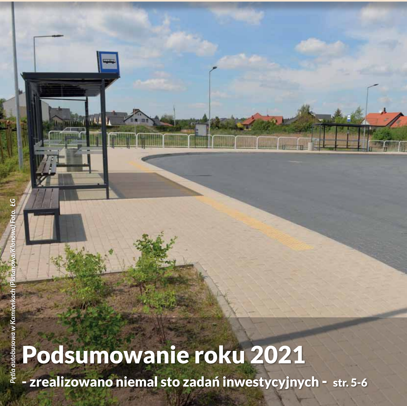
Pętla autobusowa w Kamionkach (Platanowa/Klonowa)