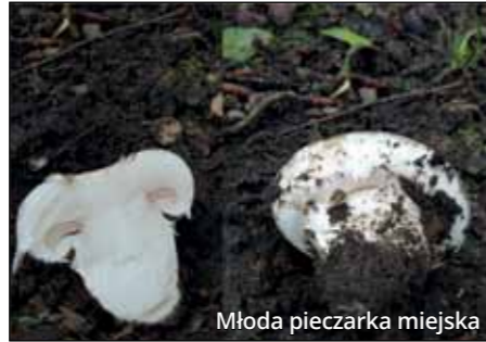
Młoda pieczarka miejska