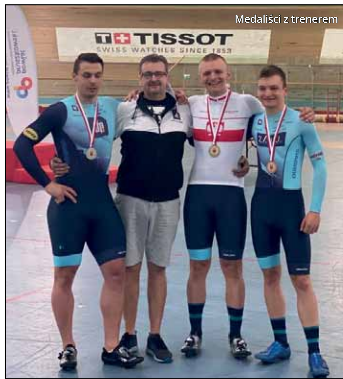
Medaliści z trenerem