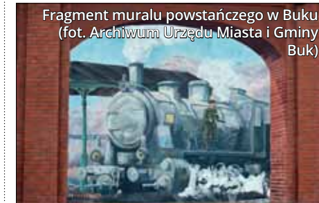
Fragment muralu powstańczego w Buku

Dla miłośników kolei obowiązkowym punktem odwiedzin powinna być Makieta Borówiec. Na powierzchni ponad 250 m 2 powstał tam miniaturowy świat, w którym kilkadziesiąt składów kolejowych porusza się wśród pięknie przedstawionych krajobrazów współczesnej Europy. Pociągi kursują po powierzchni, pod ziemią i na estakadach, a nad nimi latają miniaturowe samoloty. Dodatkowych wrażeń zapalają się gwiazdy, a budynki, pociągi i inne pojazdy rozświetlają tysiącem świateł. Na ekspozycji ukryto wiele smaczków – od postaci Świętego Mikołaja po złoty pociąg. Przy okazji wizyty w Borówcu warto zobaczyć instalację „Pamięć drewna” na rynku w Kórniku, której częścią są... podkłady kolejowe. Poszukiwacze kolejowych