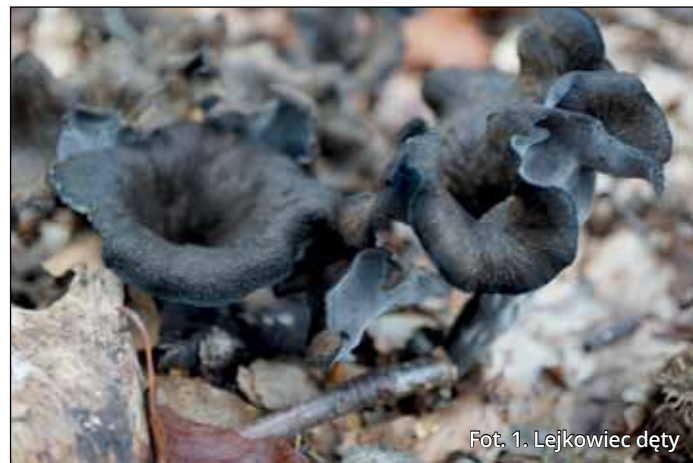
Fot. 1. Lejkowiec dęty

Zgola inne owocniki znajdziemy w grupie grzybów poliporoidalnych. Grzyby te zazwyczaj rozkładają martwe drewno, czasem możemy znaleźć je na pniach żywych drzew. Są więc saprotrofami, bądź patogenami słabości. Ich cechą charakterystyczną jest hymenofor składający się z głębokich rurek, tzw. porów (poliporoidalny można przetłumaczyć jako składający się z wielu porów). Jako przedstawiciela można tutaj podać drobnoporka modrego (Fot. 3) i całą gamę jego blisko spokrewnionych kuzynów. Najbardziej tajemnicze owocniki tworzą grzyby kortycyjoidalne. Zazwyczaj wyglądają jak cienka pajęczyna splecionych strzępek rozciągniętych na powierzchni martwego drewna. Można je również spotkać rosnące na mchu czy nawet na innych grzybach.