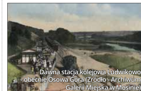
Dawna stacja kolejowa Ludwikowo - obecnie Osowa Góra

smaczków z pewnością docenią też mural w Buku, na którym przedstawiono scenę rozbrojenia niemieckiego pociągu na tamtejszym dworcu kolejowym w przedmiedniu wybuchu powstania wielkopolskiego.