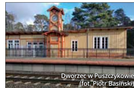
Dworzec w Puszczykowie

stycznej-questu, której trasa rozpoczyna się na tamtejszej stacji kolejowej. Gra pozwala poznać niezwykłą historię wzorcowej wsi. Z początku XX wieku pochodzą też budynki dworców kolejowych na Szlaku Letniska Puszczykowo, które powstały, gdy miejscowość przyciągała tysiące spragnionych wypoczynku poznanianów. Obecnie budynek stacji Puszczykówko nadal służy podróżnym, a ich uwagę przyciąga oryginalny, zabytkowy zegar dworcowy. W Puszczykowie z kolei „stoi na stacji” Lokomotywa – restauracja w budynku dawnego dworca, a po drugiej stronie torów zachował się poniemiecki bunkier przeciwodłamkowy. Stacje w Puszczykowie i w Osowej Górze posłużyły jako inspiracja dla filmu i książki „Tarapaty 2”, co pokazują specjalne ścieżki zwiedzania dostępne w aplikacjach turystycznych Puszczykowa i Mosiny. Dawniej linią do Osowej Góry dojeżdżali letnicy, którzy zmięzali nad Jezioro Góreckie. Dziś po tej trasie kursuje Mosińska Kolej Drezynowa, proponując wyprawę na pokładzie drezy-