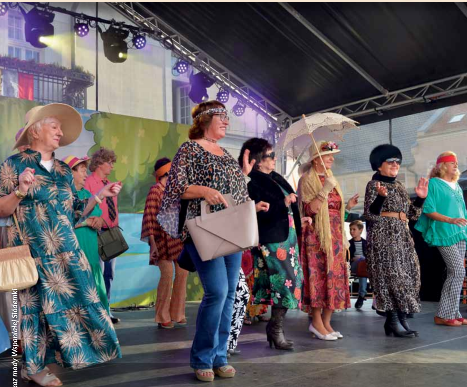
Pokaz mody Wspomnianej Siódmki