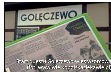
Start questu Gołęczewo-wieś wzorcowa

„Pociąg już się w Gołęczewie zatrzyma...”. Tak brzmią pierwsze słowa gry tury-