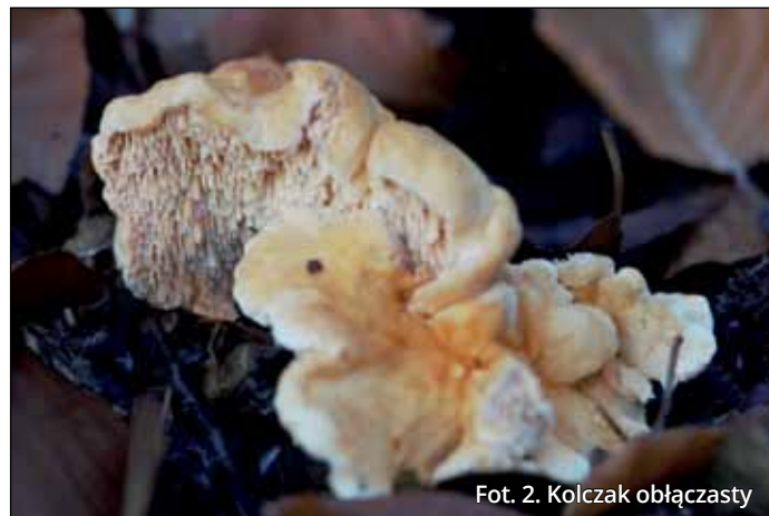
Fot. 2. Kolczak obłączasty