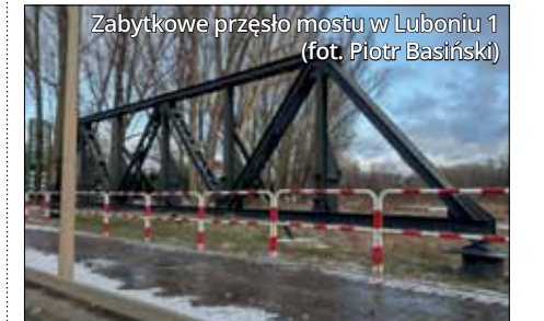
Zabytkowe przeseło mostu w Luboniu 1

Fani polskiej (i nie tylko!) motoryzacji koniecznie powinni odwiedzić Muzeum Sztuki Inżynierskiej w Fiałkowie. Kolekcja Zbigniewa Koprasy obejmuje kilkadziesiąt samochodów i motocykli z całego świata, w tym polskie junaki, osy i rzadki, sprawny egzemplarz mikrusa. Ekspozyty mają najróżniejsze rozmiary – od znaków drogowych przez syrenkę z autografem Bohdana Łazuki po zabytkowy neon