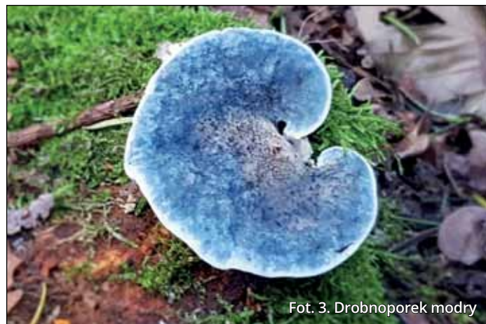
Fot. 3. Drobnoporek modry