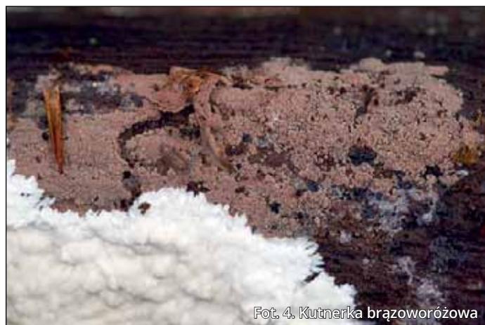
Fot. 4. Kutnerka brązoworóżowa

wierzchołek możemy dostrzec ogromne bogactwo owocników tworzonych przez grzyby. To bogactwo barw, form i kształtów bardzo często ani trochę nie przypomina grzybów, które w okresie jesiennym trafiają do koszyków grzybiarzy.