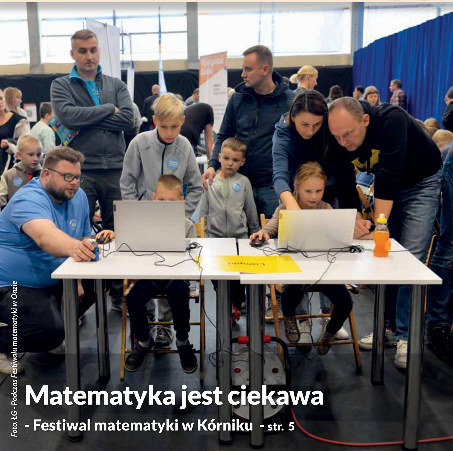
Podczas Festiwalu matematyki w Oazie