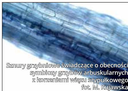
Sznury grzybnikowe świadczące o obecności symbiozy grzybów arbuskularnych z korzeniami wiązu szypułkowego