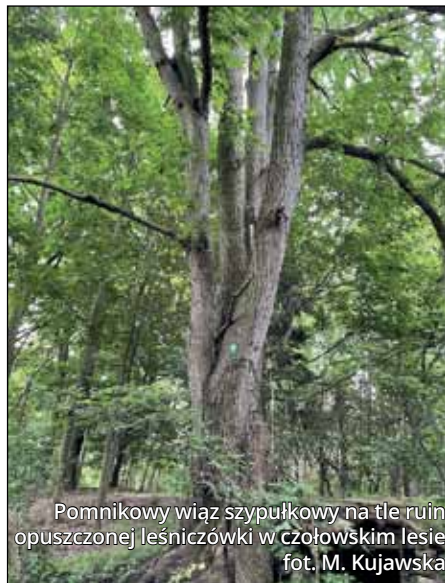
Pomnikowy wiąz szypułkowy na tle ruin opuszczonej leśniczówki w czołowskim lesie