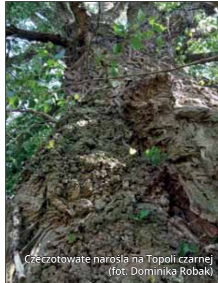
Czczotowate narośla na Topoli czarnej

światem zmarłych. Jeden z przesądów mówił, że jeżeli wichura wyrwie starą osikę – umrze starsza osoba, zaś gdy młode drzewo – zginie dziecko. W mitologii celtyckiej drzewo to wiąże się z wojną, a Celtowie wyrabiali z jej drewna tarcze. Topola czarna, zwana również sokorą, jest drzewem żyjącym stosunkowo krótko – za górną granicę wieku należy przyjąć 150–180 lat. Jest głównym składnikiem lasów łęgowych w dolinach rzek. Pień młodych drzew jest szaro-biały lub żółtawo-szary i ciemnieje wraz z wiekiem. Pnie starych drzew są ciemne oraz spękane i bardzo często pokrywają je guzowate narośla, z których obficie wyrastają krótkie pędy. Drewno takie nosi nazwę drewna czeczotowatego i w przeszłości było używane do wyrobu artystycznych mebli czy nawet podłóg. Z kolei topola biała, zwana inaczej białodrzewem, jest drzewem długo żyjącym – dożywa 300 lat i osiąga imponujące rozmiary do 40 metrów wysokości. Pień młodych drzew pokryty jest gładką, szaro-białą lub zielonkawo-szarą korowiną. Spotyka się również drzewa o korowinie prawie tak białej, jak u brzozy. W dolnej części pnia drzew starszych korowina pęka i staje się ciemna. W przeszłości topole traktowano jako swoiste piorunochrony i sadzono je w takiej odległości od domu, aby piorun miał w co uderzyć, ale na tyle blisko, żeby chronić dom przed demonami, które miały panicznie bać się piorunów. Topola biała ma być związana z życiem po śmierci, zaś czarna oznaczać ją ze