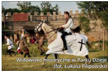
Widowisko historyczne w Parku Dzieje

Częścią rezydencji Raczyńskich w Rogalinie jest powozownia z kolekcją pojazdów używanych przez ziemiaństwo wielkopolskie. Czego tam nie ma! Pojazdy