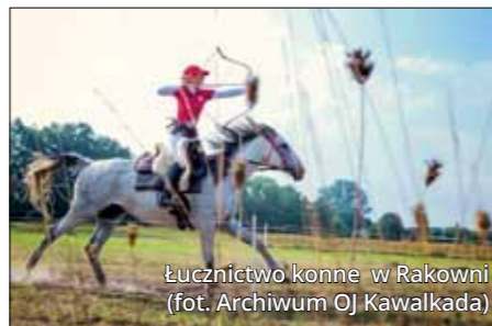
Łuczniczstwo konne w Rakoniewicach