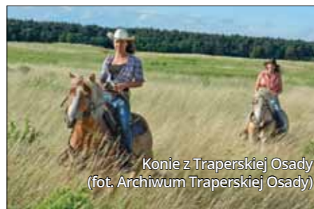
Konie z Traperskiej Osady

używane do objazdu pól czy polowań (polówka, bryczki), spacerowo-sportowe wolanty, wyjazdowo-spacerowe victorie i karety. Obok nich stoją używane w miastach plauka i dorożka oraz... lektyki. Zbiory uzupełniają sanie wyjazdowe i saneczki dziecięce do psiego zaprzęgu. Historyczne pojazdy znajdują się również w kolekcji zamku w Kórniku. Dormeza, przystosowana do spania, służyła do dłuższych wypraw, a karety i lekka kaleśza to pojazdy reprezentacyjne. Budynki powozowni zachowały się też w obrębie posiadłości Turnów w Objezierzu i w rezydencji Mielżyńskich w Iwnie, a część zbiorów Muzeum Przyrodniczo-Łowickiego w Uzarzewie eksponowana jest w stajni-wozowni, której fasadę zdobi rzeźba głowy konia.