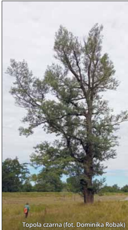
Topola czarna

światem zmarłych. Jeden z przesądów mówił, że jeżeli wichura wyrwie starą osikę – umrze starsza osoba, zaś gdy młode drzewo – zginie dziecko. W mitologii celtyckiej drzewo to wiąże się z wojną, a Celtowie wyrabiali z jej drewna tarcze. Topola czarna, zwana również sokorą, jest drzewem żyjącym stosunkowo krótko – za górną granicę wieku należy przyjąć 150–180 lat. Jest głównym składnikiem lasów łęgowych w dolinach rzek. Pień młodych drzew jest szaro-biały lub żółtawo-szary i ciemnieje wraz z wiekiem. Pnie starych drzew są ciemne oraz spękane i bardzo często pokrywają je guzowate narośla, z których obficie wyrastają krótkie pędy. Drewno takie nosi nazwę drewna czeczotowatego i w przeszłości było używane do wyrobu artystycznych mebli czy nawet podłóg. Z kolei topola biała, zwana inaczej białodrzewem, jest drzewem długo żyjącym – dożywa 300 lat i osiąga imponujące rozmiary do 40 metrów wysokości. Pień młodych drzew pokryty jest gładką, szaro-białą lub zielonkawo-szarą korowiną. Spotyka się również drzewa o korowinie prawie tak białej, jak u brzozy. W dolnej części pnia drzew starszych korowina pęka i staje się ciemna. W przeszłości topole traktowano jako swoiste piorunochrony i sadzono je w takiej odległości od domu, aby piorun miał w co uderzyć, ale na tyle blisko, żeby chronić dom przed demonami, które miały panicznie bać się piorunów. Topola biała ma być związana z życiem po śmierci, zaś czarna oznaczać ją ze