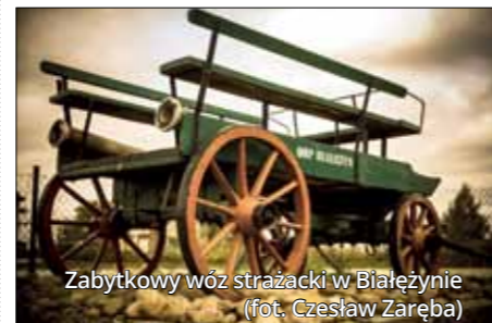
Zabytkowy wóz strażacki w Białeźnicy