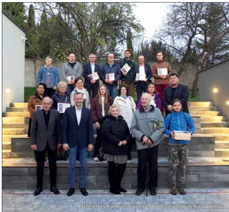
Uczestnicy konkursu i jurorzy podczas ogłoszenia wyników