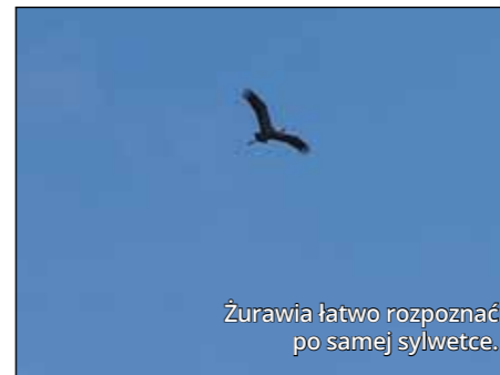
Żurawia łatwo rozpoznać po samej sylwetce.

niezajmujących się nauką zawodowo i naukowców-profesjonalistów. Jak konkretnie wykorzystywane są udostępniane dane? Można na przykład prześledzić wędrówki osobników różnych gatunków zwierząt, w tym migracje ptaków. W przypadku niektórych gatunków obcych można też monitorować, w jakim tempie i na jakich nowych obszarach się rozprzestrzeniają. Może to pomóc w opracowywaniu strategii zwalczania niepożądanych gatunków obcych i ochrony gatunków rodzimych. Dobrym przykładem są tu obserwacje masowych pojawów biedronek azjatyckich, które zagrażają populacji rodzimej dla Polski biedronki siedmiokropki. Innym pomysłem na wykorzystanie danych jest sprawdzenie, czy siewki różnych gatunków drzew i krzewów pojawiają się w innych niż dotychczas miejscach, a więc odpowiedzieć na pytanie, czy gatunki „poszukują” obszarów, w których łatwiej będzie przetrwać w warunkach zmieniającego się klimatu. Można też określić, o ile wcześniej kwitną różne gatunki roślin w stosunku do poprzednich lat, a z wykorzystaniem zaawansowanych metod modelowania nawet przewidzieć, jak te zmiany będą postępować w przyszłości. Przykładowo, według badań prowadzonych m.in. w naszym Instytucie, za 30 lat zawilec gajowy będzie kwitnął ponad miesiąc wcześniej niż obecnie. Co ważne, wszystkie te obserwacje są dostępne dla każdego za darmo. Mogą więc również zostać wykorzystane przez uczniów, studentów czy nauczycieli przyrody, biologii i geografii.