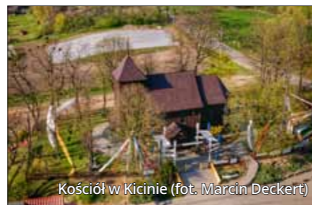
Kościół w Kicinie

W zabudowie wielu miejscowości powiatu poznańskiego można dostrzec pozostałości z czasów zaborów. Do najbardziej okazałych należą fabryki na Lubońskim Szlaku Architektury Przemysłowej. Towarzyszy im unikatowy zespół budynków dla kadry zarządzającej fabryki chemicznej. Pruski rodowód mają również zabudowania wokół placu Bojanowskiego. Unikatową historią może się poszczycić Gołęczewo, założone jako pruska wieś wzorcowa – przegląd architektury niemieckich landów. Alpejski styl uzdrowski widoczny jest w zabudowaniach Ludwikowa oraz budynkach dworców kolejowych Puszczykówko i Puszczykowo. Na przełomie XIX i XX wieku miejscowość zyskała popularność jako cel podmiejskich wycieczek z Poznania. Powstałe wówczas wille wśród