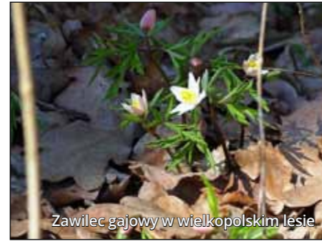
Zawilec gajowy w wielkopolskim lesie

Naukę uprawianą w sposób wykorzystujący dane zebrane przez wolontariuszy określa się mianem nauki obywatelskiej, ponieważ wyniki otrzymuje się dzięki współpracy osób