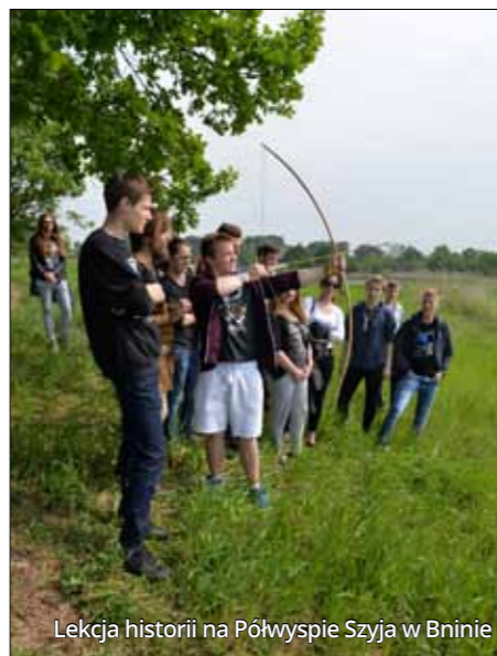
Lekcja historii na Półwyspie Szyja w Bninie

stanowiły ponoć niegdyś jedną przestrzeń, rozdzieloną później pierzeją kamienic. Dzisiejszy Kórnik składa się z dawnych organizmów miejskich: Bnina i Kórnik, o czym świadczą obecność dwóch ratuszy (bniński mieści dziś zbiory Izby Pamiątek Regionalnych). Pomiędzy nimi znajduje się Prowent – dawny folwark, w którym na świat przyszła Wisława Szymborska. Kolejnym podwójnym miastem jest Murowana Goślina. Stara Murowana ma średnio-wieczny rodowód, podczas gdy oddzielone doliną Trojanki Zielone Wzgórze to nowe osiedle-miasteczko z rynkiem, regularnym układem ulic, a nawet obiektem stylizowanym na ratusz. Zupełnie nowy rynek powstał też w Puszczykowie, mieście o zaledwie 60-letniej metryce, które powstało z połączenia Puszczykówka, Puszczykowa, Starego Puszczykowa i Niwki.