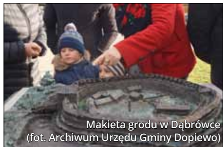
Makieta grodu w Dąbrówce

Czasem o dawnych losach miejscowości przypomina jedynie drobny akcent, jak ma to miejsce choćby w przypadku Głę-