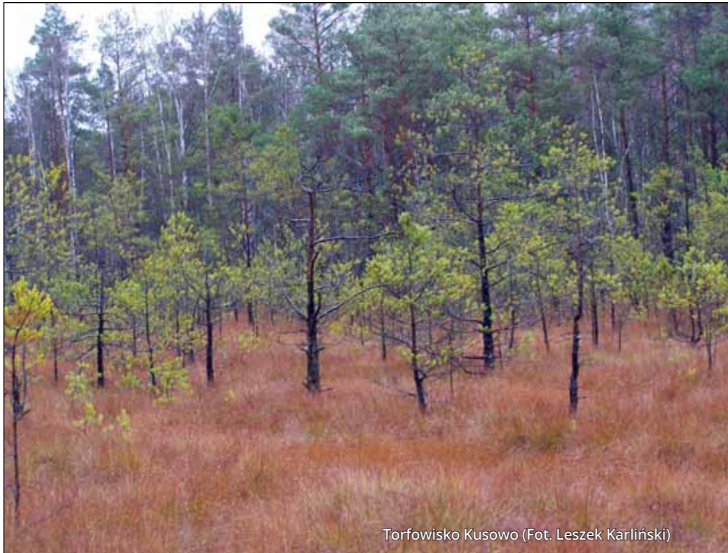
Torfowisko Kusowo

środowiska polityczne i administracyjne. Fundusz Unii Europejskiej na rzecz Sprawiedliwej Transformacji zakłada stopniowe wycofywanie się z wydobycia torfu. Czy jest coś, co można zrobić, żeby dołożyć swoją własną cegiełkę do ochrony bagien? Branża ogrodnicza, zwłaszcza produkcja roślin ozdobnych, wymaga podłoży dobrej jakości, standaryzowanych i powtarzalnych dla użytkownika, do tego dostępnych w korzystnej cenie. Torf od wielu lat spełnia te wymagania i wydaje się materiałem niezastąpionym zarówno w uprawach profesjonalnych, jak i amatorskich. Zapotrzebowanie na podłoża uprawowe stale rośnie. Raport Uniwersytetu Wageningen wykazał, że do 2050 roku popyt na nie zwiększy się aż o 400% w stosunku do 2020 roku!