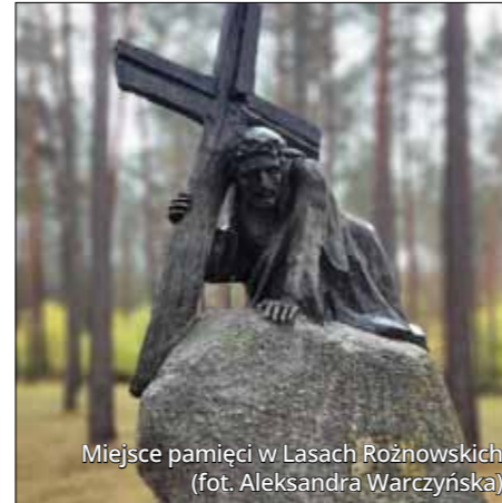
Miejsce pamięci w Lasach Rożnowskich

Na eksploratorów z otwartą głową czeka jeszcze wiele lokalnych ciekawostek. Charakterystycznym elementem panoramy Swarzędza jest efektowne Krzesło formatu XL z figurą stolarza, a w Śremie warto poszukać zabytkowej latarni gazowej, której towarzyszy postać Dziewczynki z zapałka-