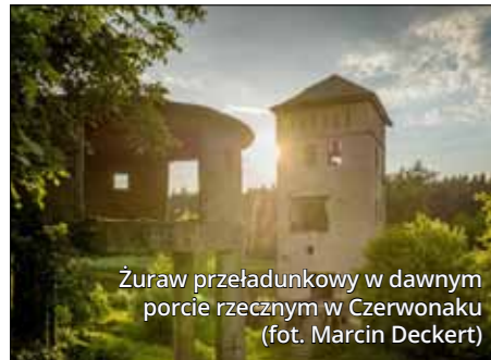
Zuraw przeladunkowy w dawnym porcie rzeczonym w Czerwonaku

Jednym z najbardziej oryginalnych obiektów przyciągających uwagę, położonych