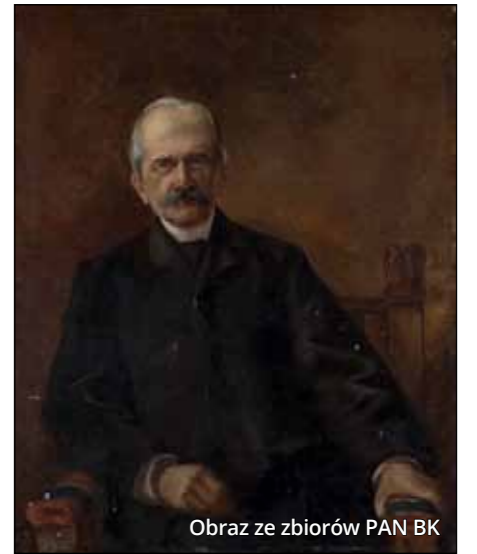
Obraz ze zbiorów PAN BK