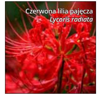
Czerwona lilia pączęca Lycoris radiata