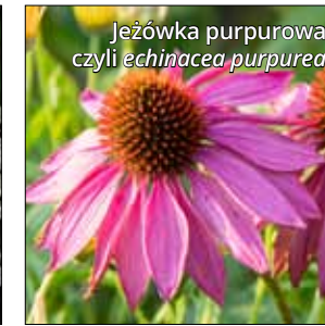
Jeżówka purpurowa czyli echinacea purpurea