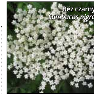
Bez czarny Sambucus nigra

Działanie naturalnych substancji bioaktywnych opiera się na różnych mechanizmach biochemicznych i genetycznych, które blokują wnikanie wirusa do organizmu czy też blokują jego replikację (powielanie materiału genetycznego zawartego w DNA lub RNA) w komórce gospodarza. W przypadku działania na wirusy RNA, substancje roślinne oddziałują głównie na enzym wirusa, odwrotną transkryptazę (ang. reverse transcriptase, RT). W przypadku wirusów DNA najczęstszym sposobem działania jest ograniczenie wnikania cząsteczek wirusa do komórki gospodarza lub zahamowanie replikacji wirusa w zaatakowanych komórkach. Jednym ze zidentyfikowanych sposobów działania przeciwko wirusom DNA jest także niszczenie osłonek wirusowych. Dezaktywowany wirus nie ma szansy dalej się namnażać i znika z organizmu. Obecnie stosuje się wiele syntetycznych leków przeciwwirusowych, które hamują replikację wirusa za pomocą różnych mechanizmów biochemicznych. Jednak niska skuteczność, cytotosycyzność i rozwój oporności wirusów