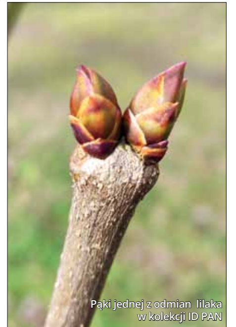
Pąki jednej z odmian lilaka w kolekcji ID PAN

temperatury przyspieszają cykl upraw roślin i umożliwiają uprawy na większych wysokościach nad poziomem morza, ale także zwiększają szkodliwe skutki stresu wodnego i wysokiego promieniowania. Klimat ma głęboki wpływ na procesy, które regulują pęknięcie pąków. Pierwszym z tych efektów są ocieplające się zimy. Ekspozycja na chłód, konieczna dla prawidłowego przebiegu endospoczynku i nabycia mrozoodporności, ma kluczowe znaczenie dla silnego i jednolitego kwitnienia i wypuszczenia liści, co jest potrzebne do uzyskania dobrych plonów, niezależnie od tego, czy są to brzoskwinie, jabłka, wiśnie czy sosny lub dęby. Drugim sposobem, w jaki zmiany klimatu wpływają na drzewa, są późne przymrozki. Drzewa nie powinny inicjować wzrostu liści, dopóki nie minie niebezpieczeństwo wystąpienia mrozu. Przypadki ekstremalnie późnych przymrozków stają się coraz częstsze, a mają one szkodliwy wpływ nie tylko na drzewa owocowe, powodując utratę plonów, ale także na drzewa leśne, mróz może bowiem uszkadzać drzewa, przez co stają się one podatniejsze na choroby i szkodniki.