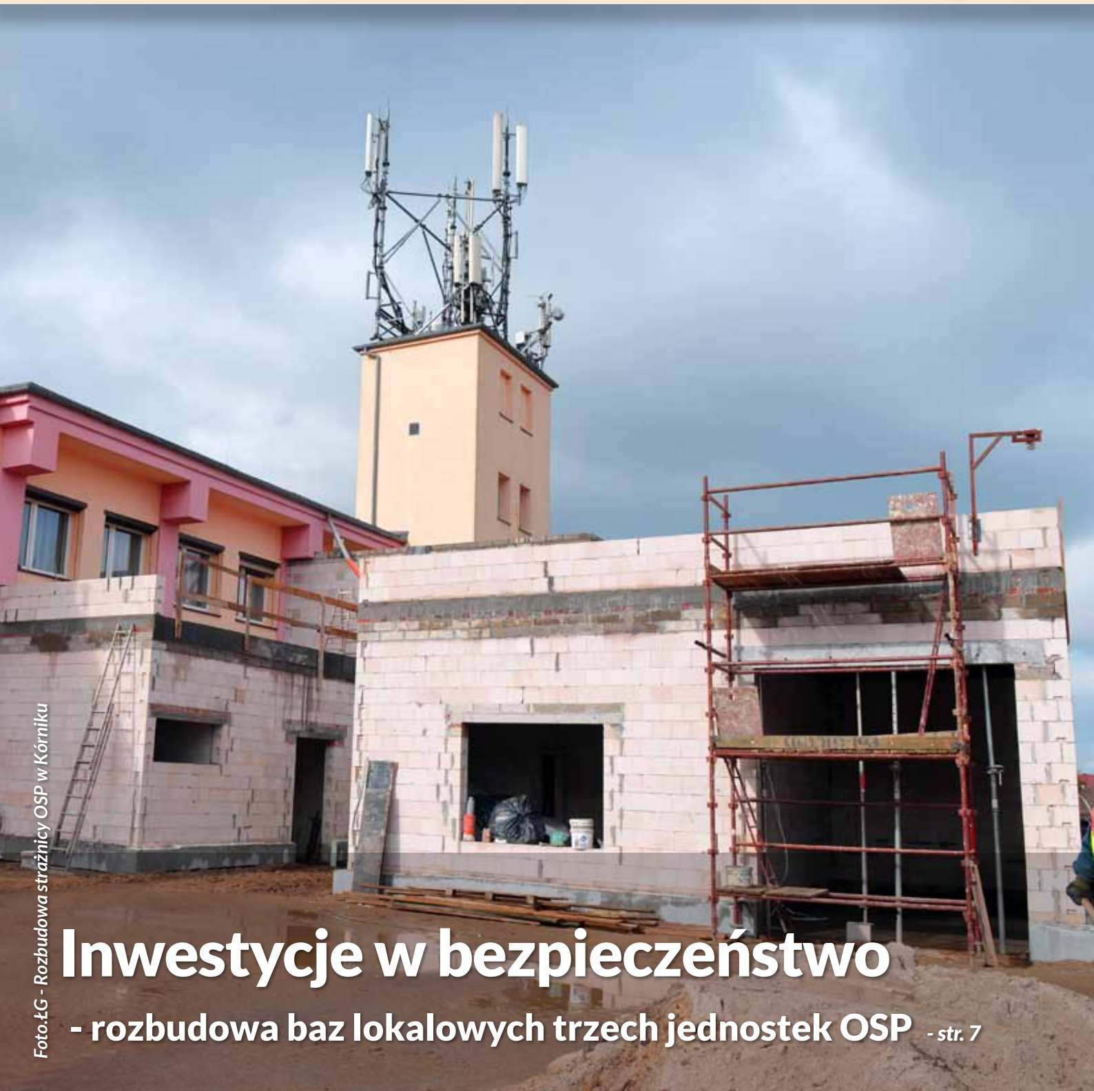
Rozbudowa strażnicy OSP w Kórniku