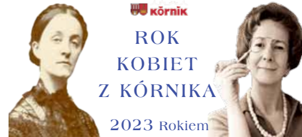
Jadwigi Zamoyskiej i Wisławy Szymborskiej

ŁG: „Niektórzy lubią poezję...” jak pisała Szymborska, ale jeszcze mniejsza grupa o niej rozmawia. Jaki był odbiór Twojej opowieści o malarstwie i poezji?