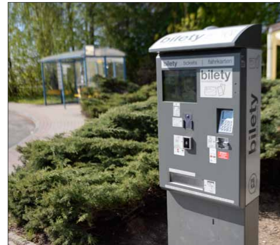
Przy przystanku autobusowym Kórnik/Bnin Osiedle zamontowano biletomat.