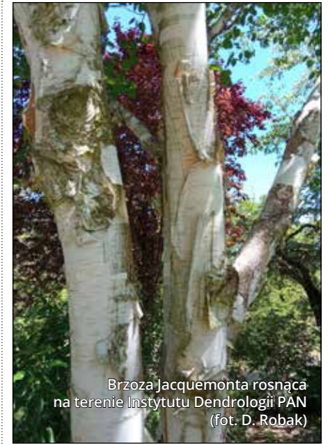
Brzoza Jacquemonta rosnąca na terenie Instytutu Dendrologii PAN