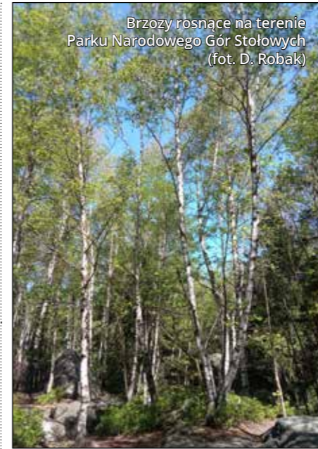
Brzozy rosnące na terenie Parku Narodowego Gór Stołowych

Ludzie szczególnie cenili sobie to drzewo i wykorzystywali je do różnych praktyk i rytuałów. Indeks użyć brzozy jest niezwykle szeroki, pełni ona istotną rolę przy corocznych świętach, a jej gałązki wykorzystywane są w czasie różnych zabaw. W Wielkopolsce gałęzie brzozy były zrywane w Niedzielę Palmową i przetrzymywane w naczyniach z wodą – jeśli gałązki rozwinięły się przed Wielkanocą, zwiastowało to szczęście dla domu. W Niedzielę Zmartwychwstania Pańskiego brzożowe gałęzie służyły do wyganiania śpiochów z łóżek, z kolei w Poniedziałek Wielkanocny, zgodnie ze zwyczajem oblewania się wodą, chłopcy smagali dziewczęta witekami brzożowymi. Na Zielone Świątki dekorowało się domy gałązkami brzożowymi, które oprócz funkcji ozdobnej miały także znaczenie magiczne – gałązki należało wsadzić do ziemi, aby chronić się przed kretem. Do dziś podczas święta Bożego Ciała brzożki służą do dekoracji ołtarzy. Po zakończeniu uroczystości wierni zabierają