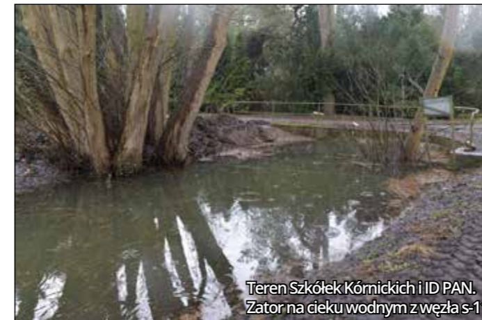
Teren Szkółek Kórnickich i ID PAN. Zator na cieku wodnym z węzła s-11