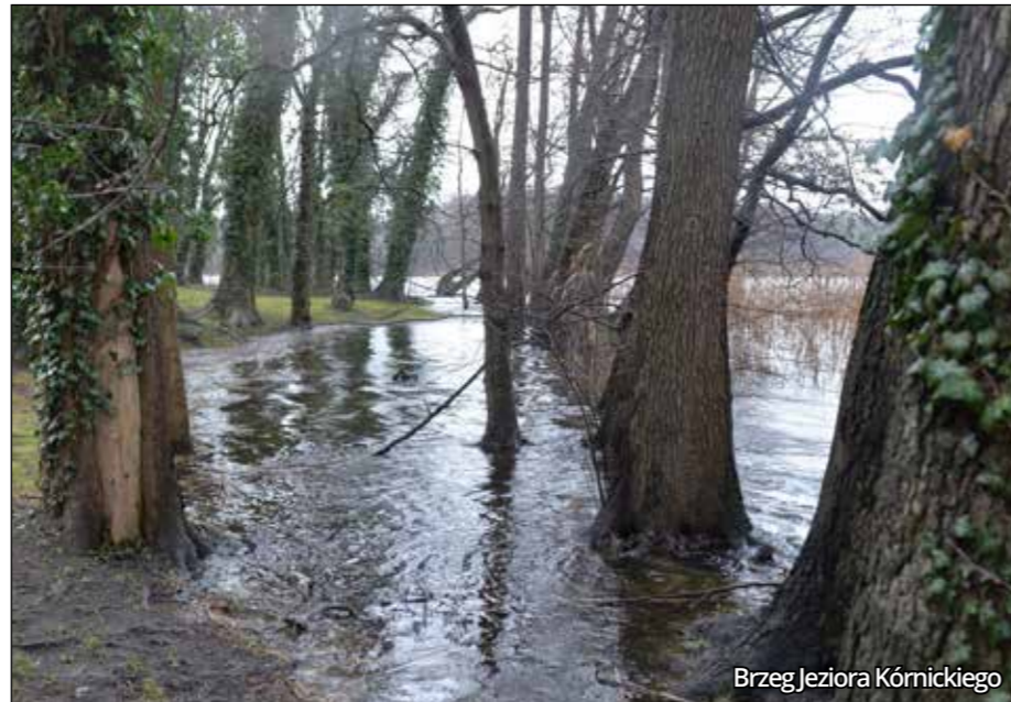
Brzeg Jeziora Kórnickiego