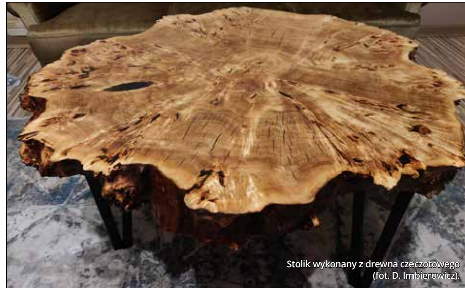
Stolik wykonany z drewna czczotowego

To, co dla jednych będzie wadą, dla innych stanowi zaletę. Wada drewna to także pojęcie względne. W wielu przypadkach, szczególnie w rzemiośle artystycznym, nieregularna budowa czy niejednolita barwa drewna są wysoce pożądane. Nadają one drewnu indywidualny charakter, co sprawia, że wyroby z jego wykorzystaniem są unikatowe. Jedną z takich wad drewna jest