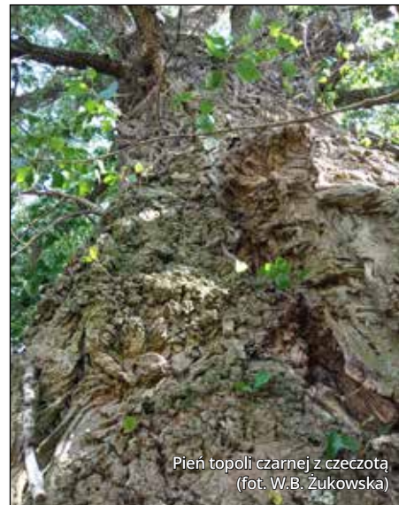
Pień topoli czarnej z czczotą

Drewno drzew jest złożonym materiałem, którego podstawową funkcją jest wsparcie mechaniczne i utrzymanie stabilności drzewa oraz przewodzenie wody i substancji mineralnych. Żywa część drewna, tzw. miękisz drzewny, stanowi magazyn substancji odżywczych. Poza tym drewno stanowi warstwę izolacyjną, chroniącą wnętrze drzewa przed uszkodzeniami i czynnikami chorobotwórczymi. To właśnie w drewnie